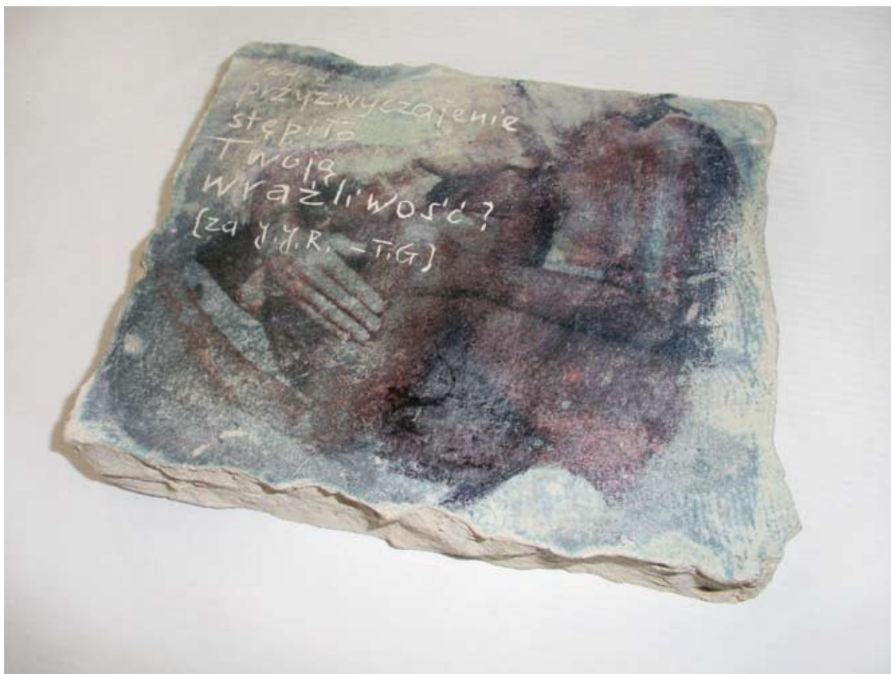
Teresa Gierzyńska Czy przyzwyczajenie stępiło Twoją wrażliwość?, 1978 gipsowa płytka, przedruk ok. 12 x 14 cm