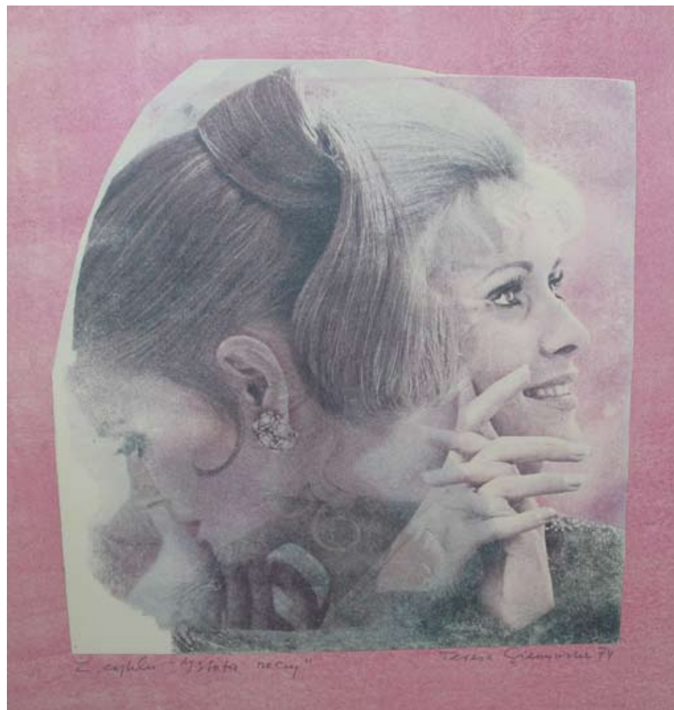
Teresa Gierzyńska Bez tytułu , 1973 z cyklu Istota rzeczy przedruk, aluminium, akryl 50 x 100 cm