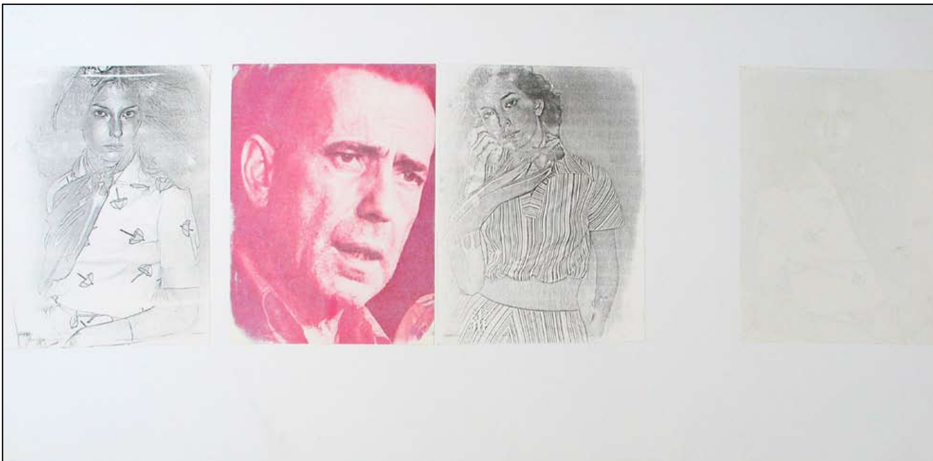
Teresa Gierzyńska Wydarzenie , 1974 z cyklu Istota rzeczy przedruk, aluminium, akryl 50 x 100 cm