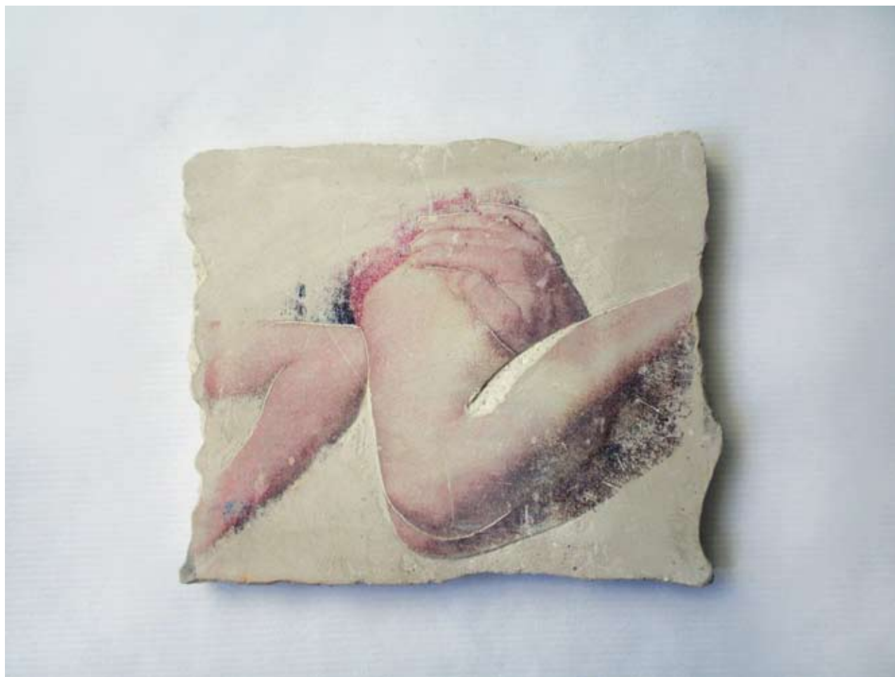
Teresa Gierzyńska Bez tytułu , 1978 gipsowa płytka, przedruk ok. 13,5 x 16 cm