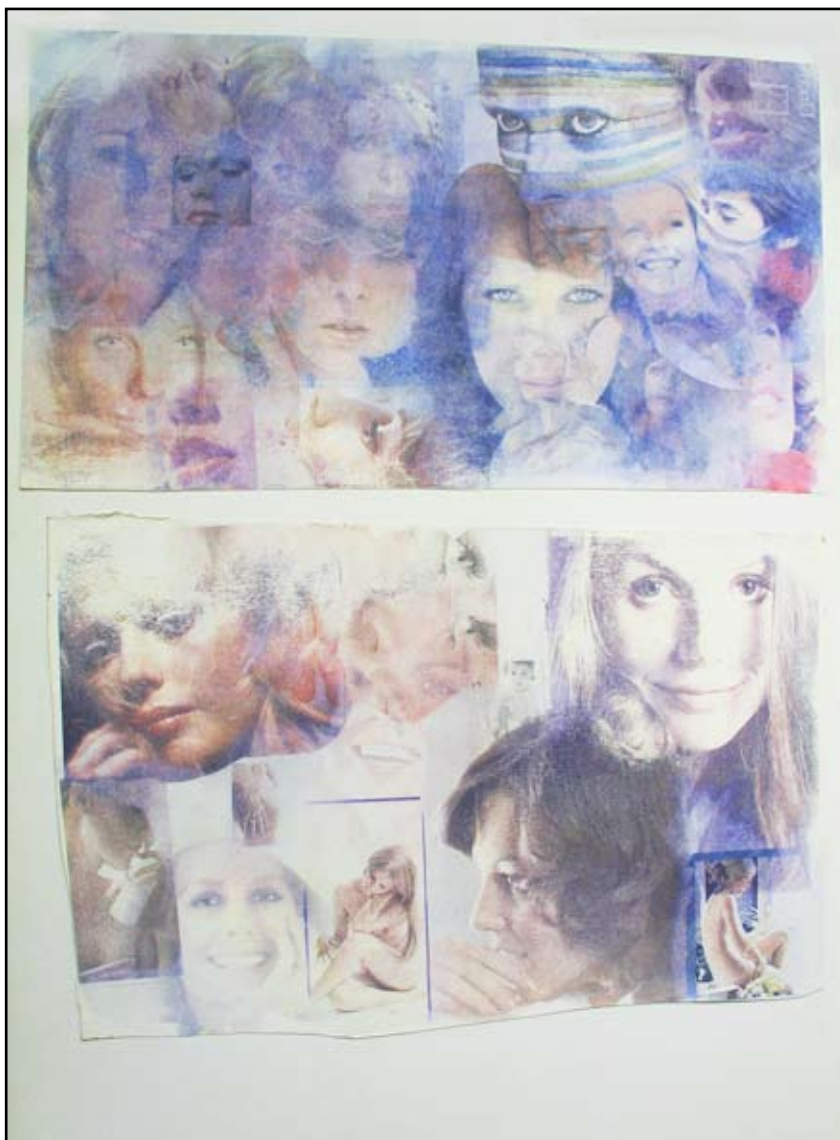
Teresa Gierzyńska Wiosenne makijaże , 1973 z cyklu Istota rzeczy przedruk, aluminium, akryl 70 x 100 cm